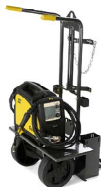
Vozík – pro snadnou přepravu zdroje Caddy® Mig a plynové lahve.