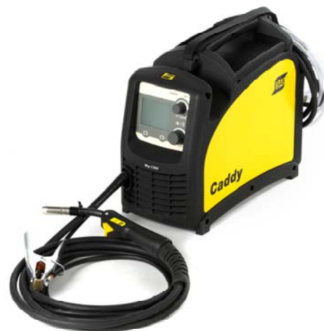
Svařovací zdroj s ramenním popruhem