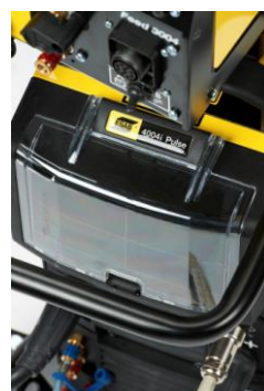
Compartment for wear parts