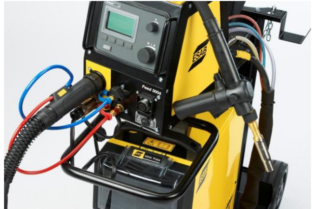
Aristo® Feed 3004 U6 a MXH 400w PP

SuperPulse™ (U8 2 ) je optimální MIG / MAG proces řízení tepelného příkonu nebo překlenovací variabilních mezer.